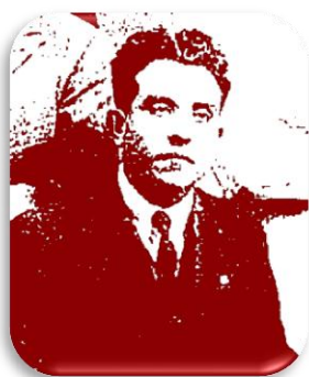
Beato Anacleto González Flores